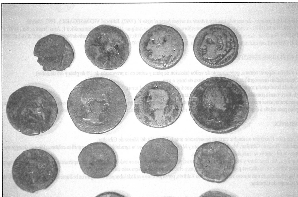
Figura 2.- Monedas Ibéricas e Hispanorromanas procedentes de Gorham's Cave. Museo de Gibraltar.