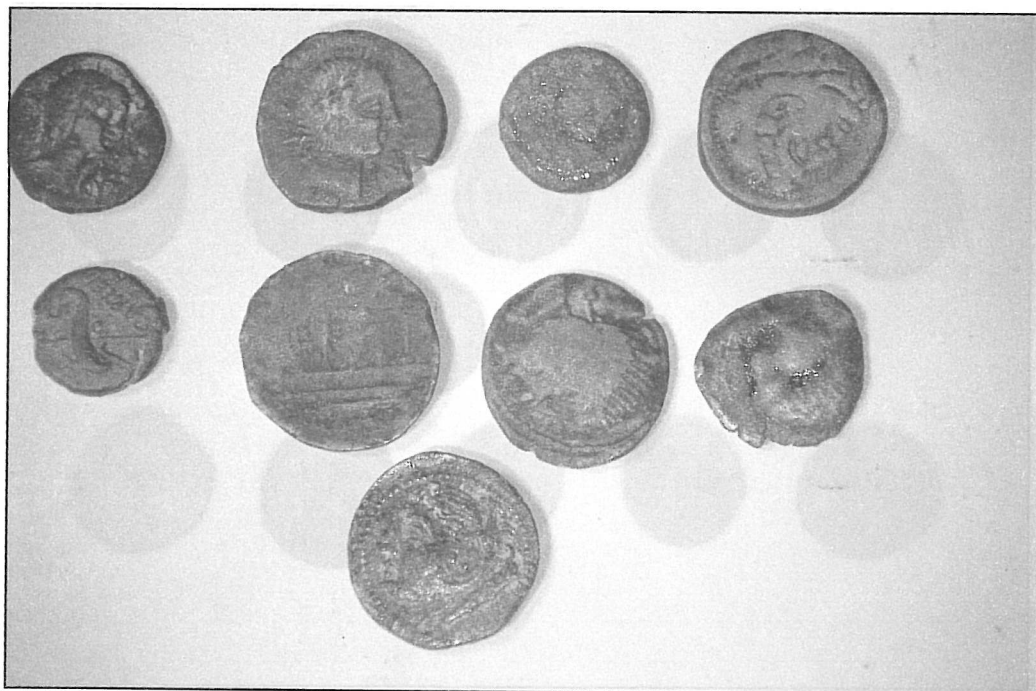
Figura 4.- Monedas Ibéricas procedentes de Gorham's Cave. Museo de Gibraltar.