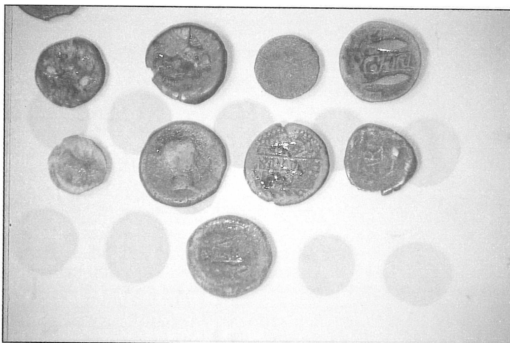
Figura 5.- Monedas Ibéricas procedentes de Gorham's Cave. Museo de Gibraltar.