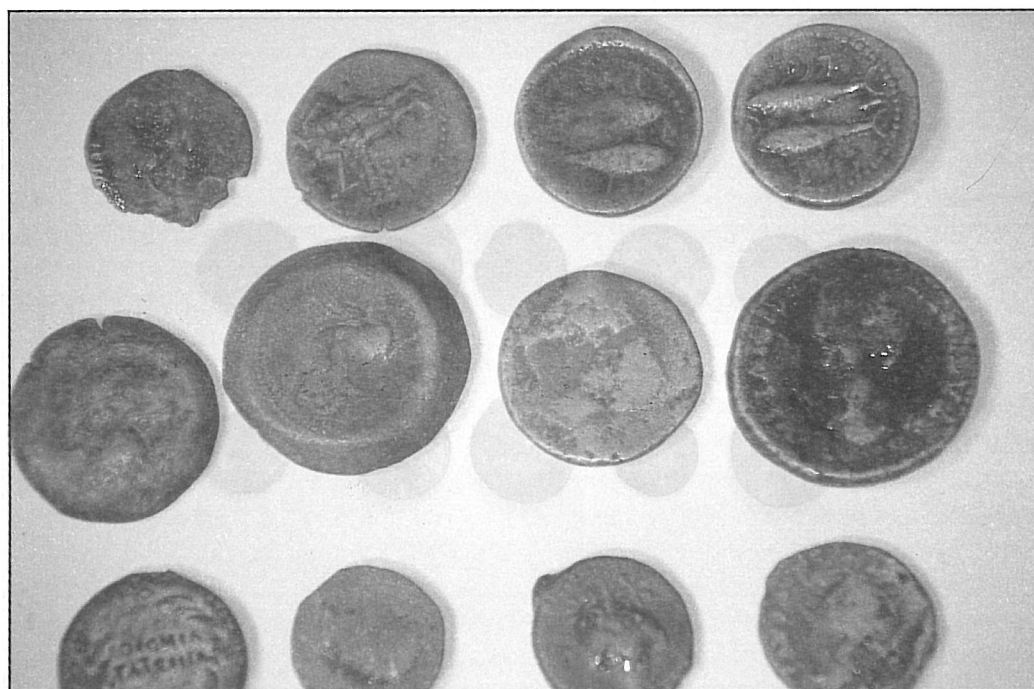
Figura 3.- Monedas Ibéricas e Hispanorromanas procedentes de Gorham's Cave. Museo de Gibraltar.