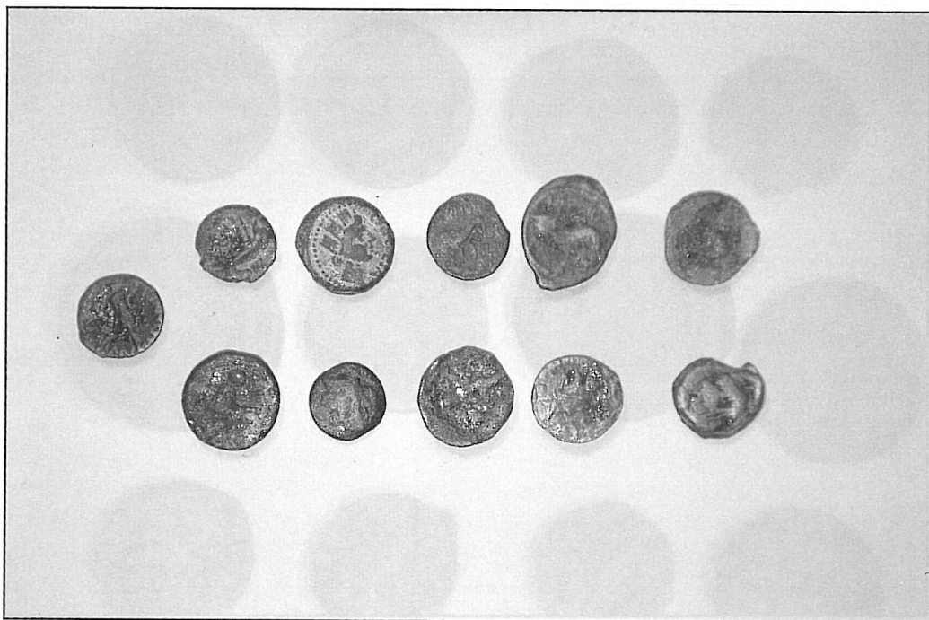
Figura 1.- Monedas procedentes de Carteia. Museo de Gibraltar.