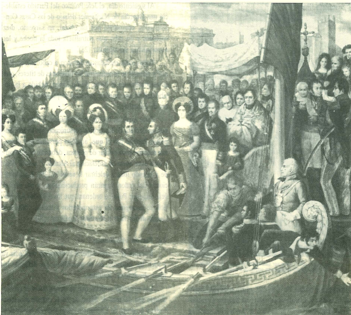
El Duque de Angulema, jefe de los "Cien Mil Hijos de San Luis", recibe a Fernando VII y a su tercera esposa, María Josefa Amalia de Sajonia, en Puerto de Santa María (Octubre de 1823).