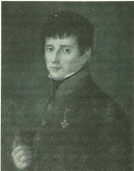
Rafael de Riego Nuñez (1785-1823) fué uno de los militares más populares de España durante el siglo XIX.

orden, solicite al Jefe Superior Político el cese del mencionado Juez (11).