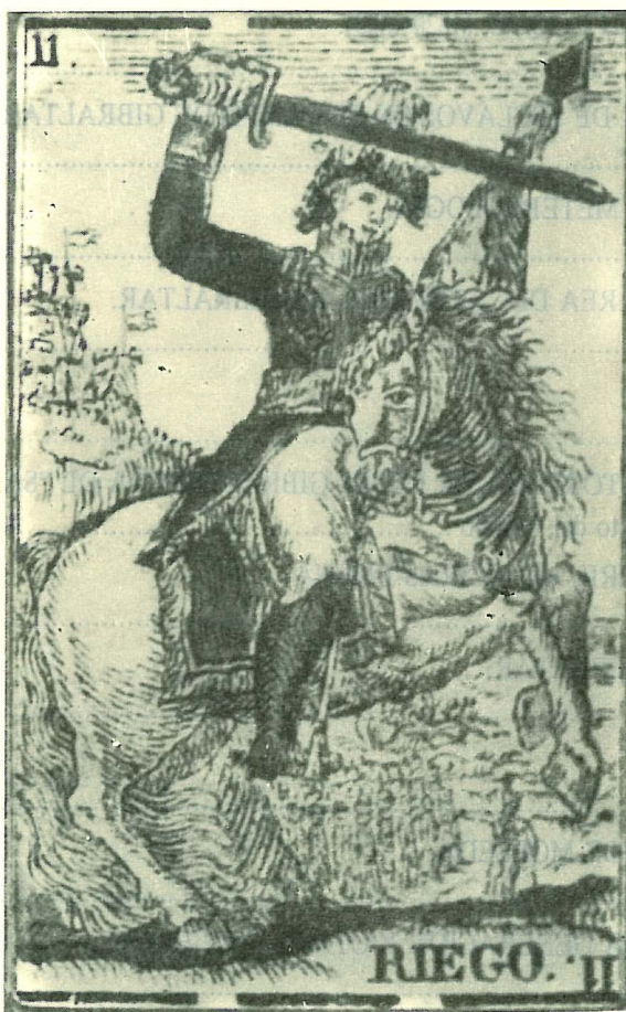
El general Riego aparece en este naipe de la época en el palo denominado "Justicia".