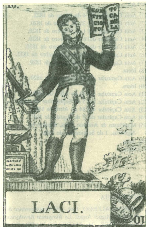
El general sanroqueño Luis de Lacy como "sota" del palo "Constitución", en un naipe de la época.