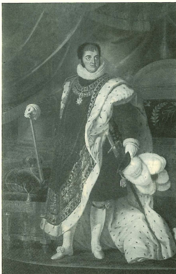
El "rey felón", como suele ser calificado Fernando VII, aparece en este cuadro vestido con anacrónico manto real.

mandante de Armas de la ciudad, quien consiguió imponer el orden y demostrar su apoyo al Sistema Constitucional (26). Este tipo de sucesos se produjeron también en Algeciras (julio de 1822) y en Cádiz por las mismas fechas.