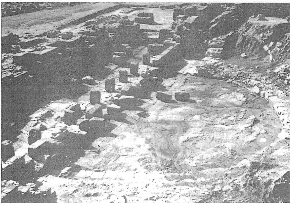
La orchestra y el escenario del teatro de Belo.

Este conjunto ornamental, de siete fuentes o nichos alternativos, estaba realizado por estatuas colocadas