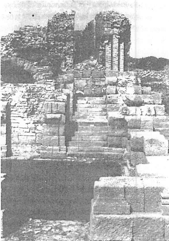
Acceso desde el pararcenium a dos niveles superiores. Este del escenario.