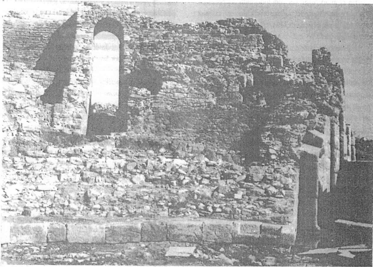
Parte Este de la cávea del teatro de Belo.

desemboca en un gran vestíbulo unido a los bastidores laterales del escenario.