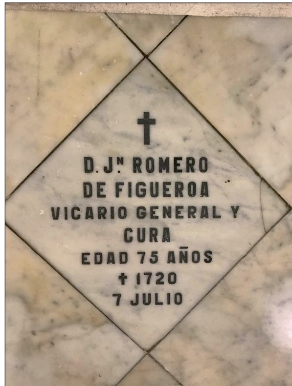
Lámina 1. Lápida sepulcral de Juan Romero de Figueroa. Centro del presbiterio. Catedral Sta. María Coronada, en Gibraltar.