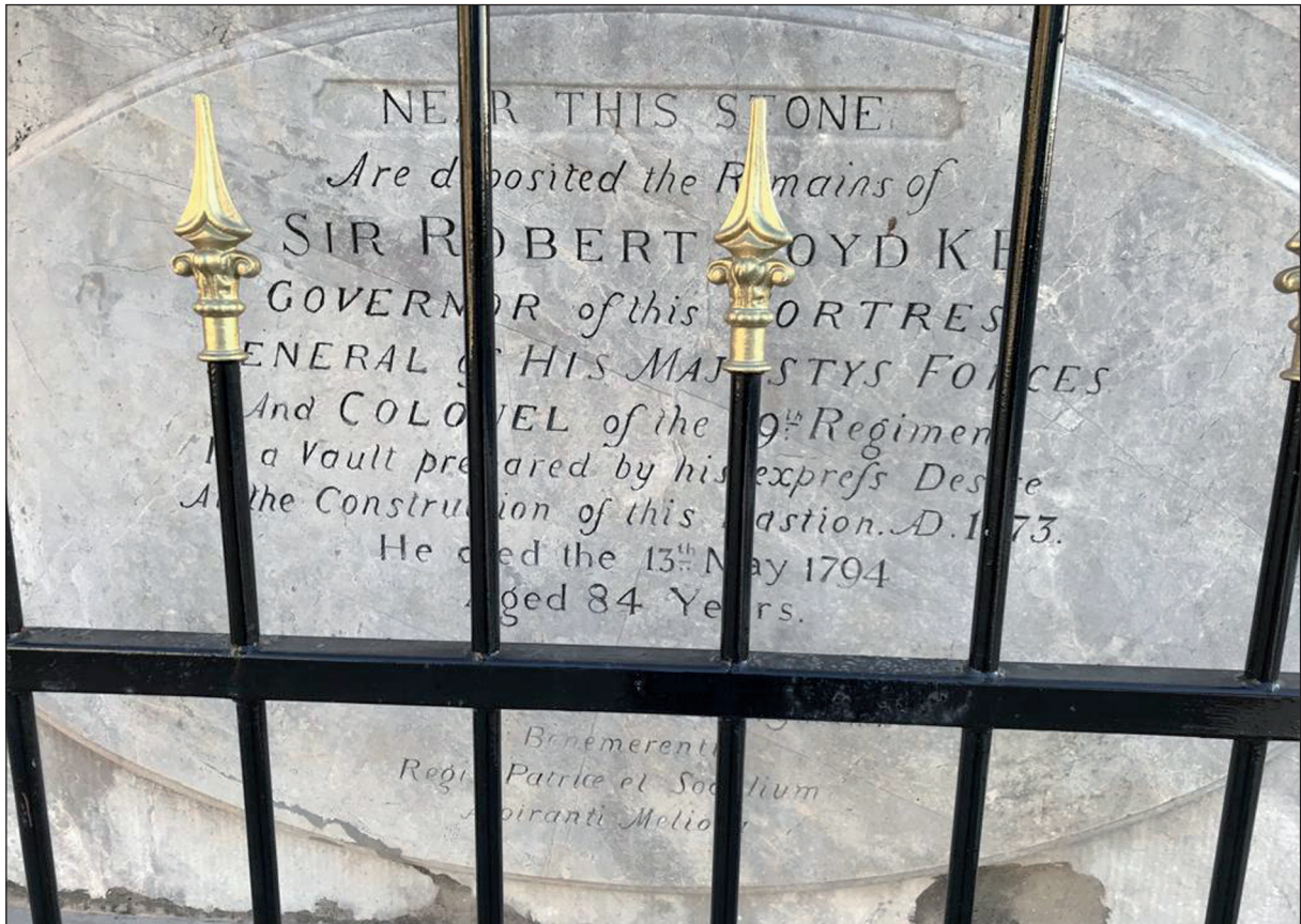
Lámina 3. Lápida recordatoria del finado Sir Robert Boyd. Fachada norte de King's Bastion o extremo sur de Line Wall Promenade.

Interpretación heráldica. K B, Knight Companion (Compañero Caballero) de la Muy Honorable Orden Militar de Bath. Recibió el título en 28 enero de 1785 por sus distinguidos servicios durante el Gran Sitio.